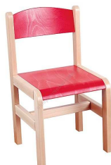
Rysunek nr 50