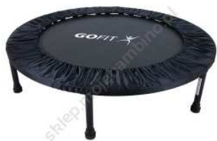
Rysunek nr 79.