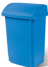
Rysunek nr 11