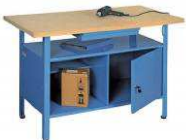
Rysunek nr 84