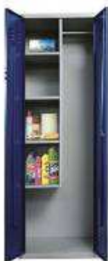
Rysunek nr 20