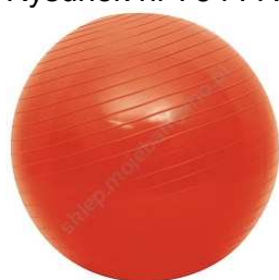
Rysunek nr 76 i 77.