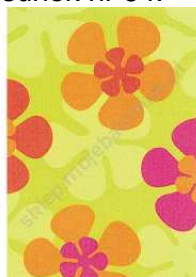
Rysunek nr 64.