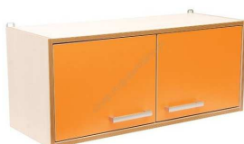
Rysunek nr 49.