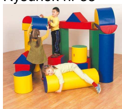
Rysunek nr 38