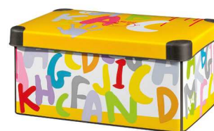
Rysunek nr 12