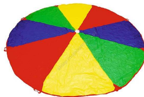
Rysunek nr 81