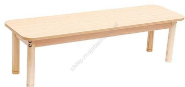
Rysunek nr 16.