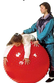
Rysunek nr 75