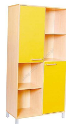
Rysunek nr 66