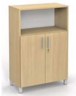
Rysunek nr 22.