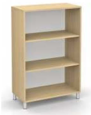
Rysunek nr 87