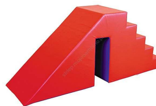
Rysunek nr 3