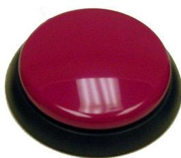
Rysunek nr 52.