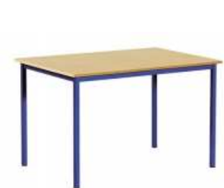
Rysunek nr 28.