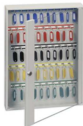
Rysunek nr 5