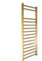
Rysunek nr 37.