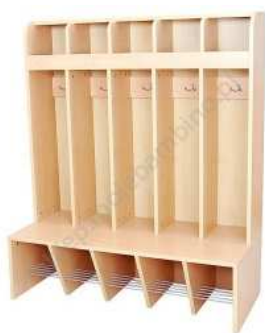
Rysunek nr 19.