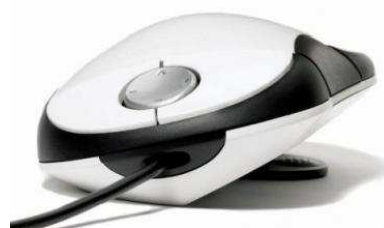
Rysunek nr 57