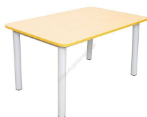
Rysunek nr 47