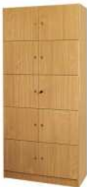
Rysunek nr 86