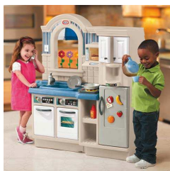
Rysunek nr 61.