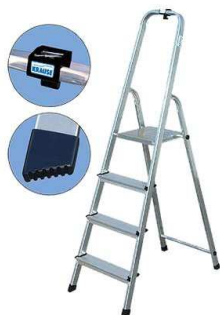
Rysunek nr 17