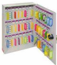
Rysunek nr 4.