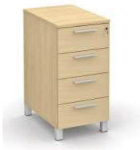
Rysunek nr 25.