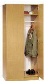
Rysunek nr 31.