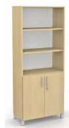
Rysunek nr 33