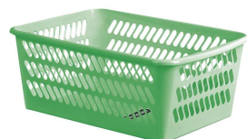
Rysunek nr 13.