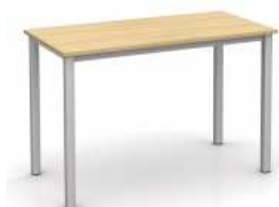
Rysunek nr 23