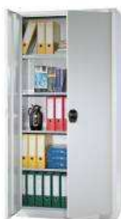
Rysunek nr 88.