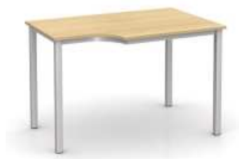
Rysunek nr 24