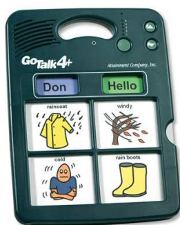
Rysunek nr 56