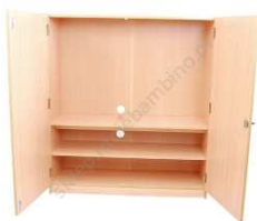
Rysunek nr 62