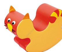
Rysunek nr 42