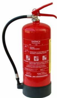
Rysunek nr 1.