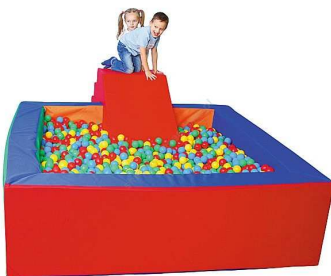
Rysunek nr 2