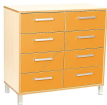
Rysunek nr 46.