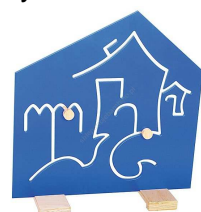
Rysunek nr 43.