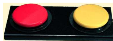
Rysunek nr 54