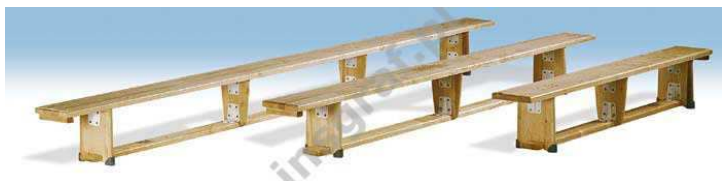
Rysunek nr 74