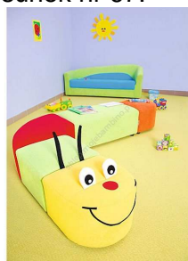
Rysunek nr 67.