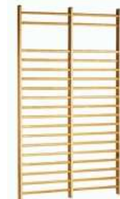
Rysunek nr 36