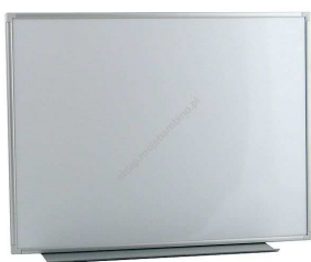
Rysunek nr 7.