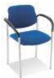
Rysunek nr 29