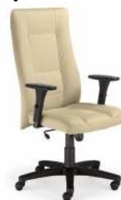
Rysunek nr 30