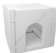
Rysunek nr 41