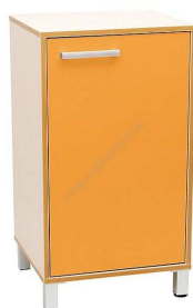
Rysunek nr 68