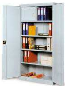
Rysunek nr 34.