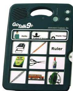
Rysunek nr 55.