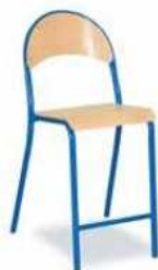
Rysunek nr 85.