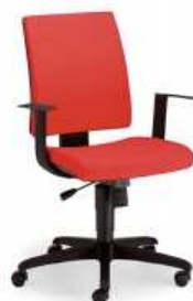
Rysunek nr 32