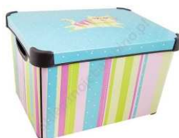
Rysunek nr 14