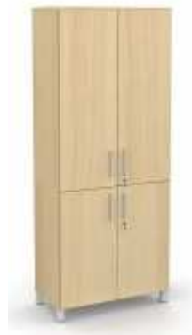
Rysunek nr 21