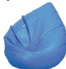
Rysunek nr 51