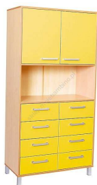
Rysunek nr 65