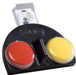
Rysunek nr 53